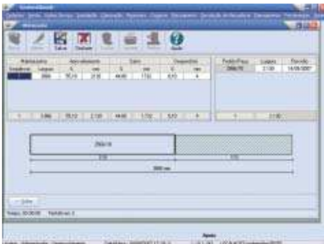
Grics: sistema da SystemGlass possibilita redução de mão-de-obra.

fábrica, a SF Informática, de São José dos Campos, SP, criou o GlassControl, programa que tem todos os recursos e controles necessários para a gestão de uma empresa beneficiadora de vidros. Do orçamento, passando pelo projeto (com desenho em escala), vendas, comissões, compras, recebimento, produção (inclusive laminados, blindados e otimização), ele controla a expedição, entrega, cobrança, fluxo de caixa e muito mais. “A grande vantagem do GlassControl é a redução dos custos operacionais com a diminuição de desperdícios, custos financeiros, prazos de entrega e imobilizado, além do total controle dos processos”, explica Antônio Carlos Gonçalves dos Santos, gerente-técnico da SF Informática.