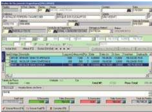
Corp Glass: a economia em tempo de execução de rotinas chega a 50%