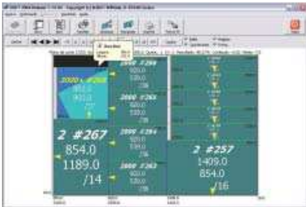
Albat+Wirsam: software da empresa ajuda a integrar processos empresariais